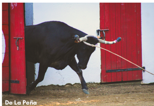
De La Peña